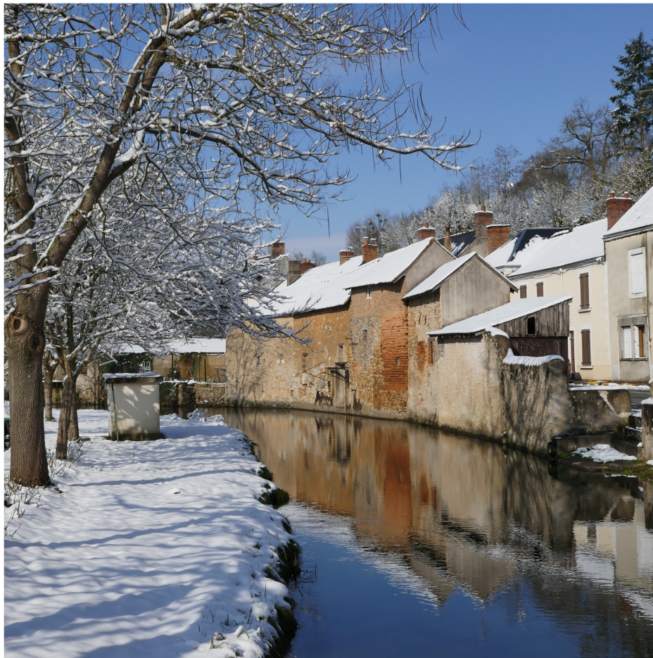
Le bief d'Avoise, en hiver, depuis la place des Deux-Fonts